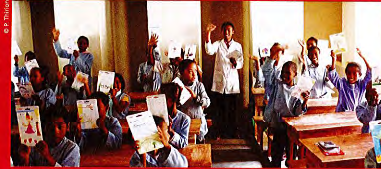
L'association Esperanza a remis aux élèves malgaches, les calculatrices offertes par les petits Toulonnais.