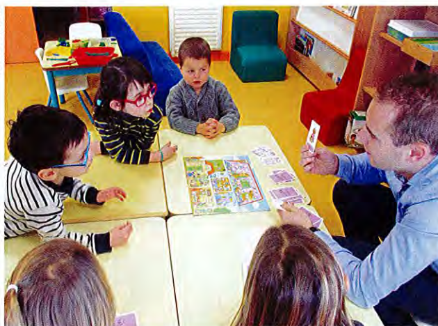
Les moyennes sections jouent au jeu Bruits de la maison , pendant qu'une élève de petite section prépare une couronne pour la Galette des rois .

La séquence du jour aborde le premier thème : reconnaître les trésors de Dieu dans la vie. « L'objectif est qu'ils prennent conscience de ce que peut apporter une fête, la joie d'être ensemble », pré-