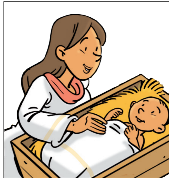
Marie et Jésus