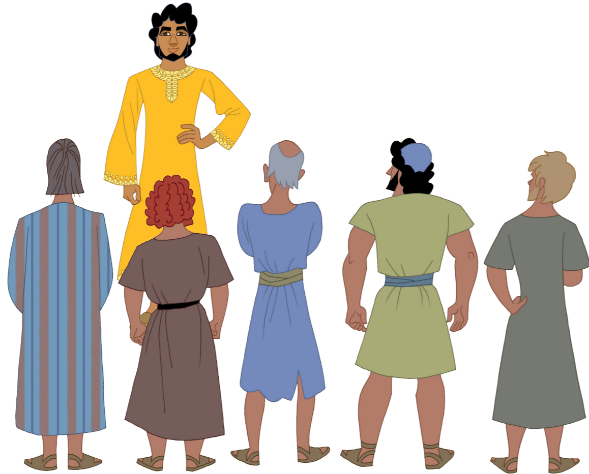
Joseph et ses frères