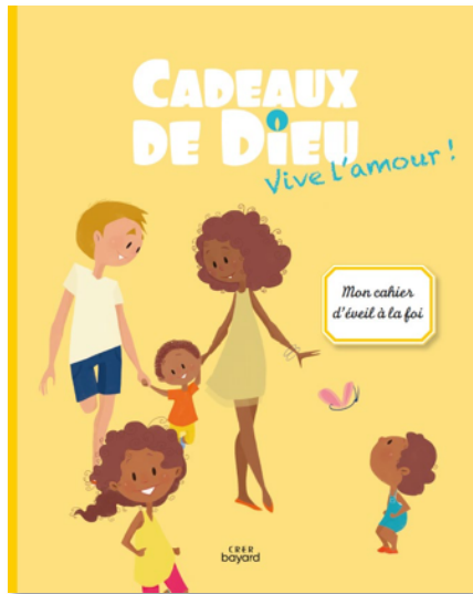
Cahier de l'enfant