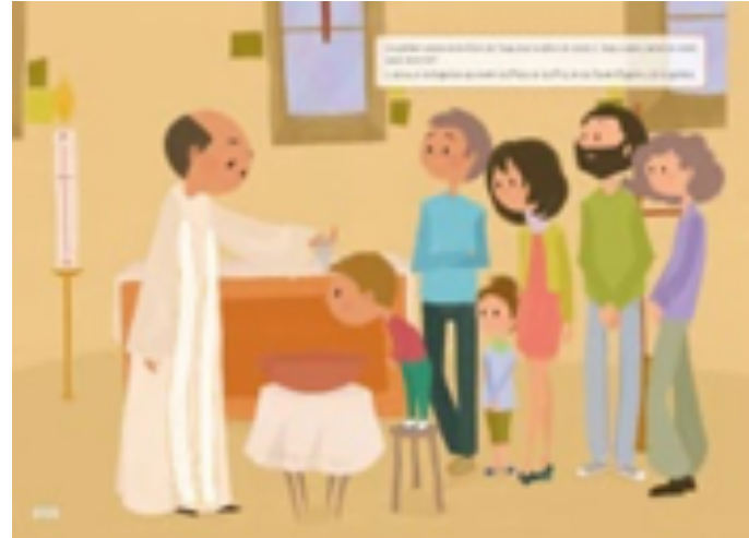
Sainte Thérèse, une vie avec Dieu